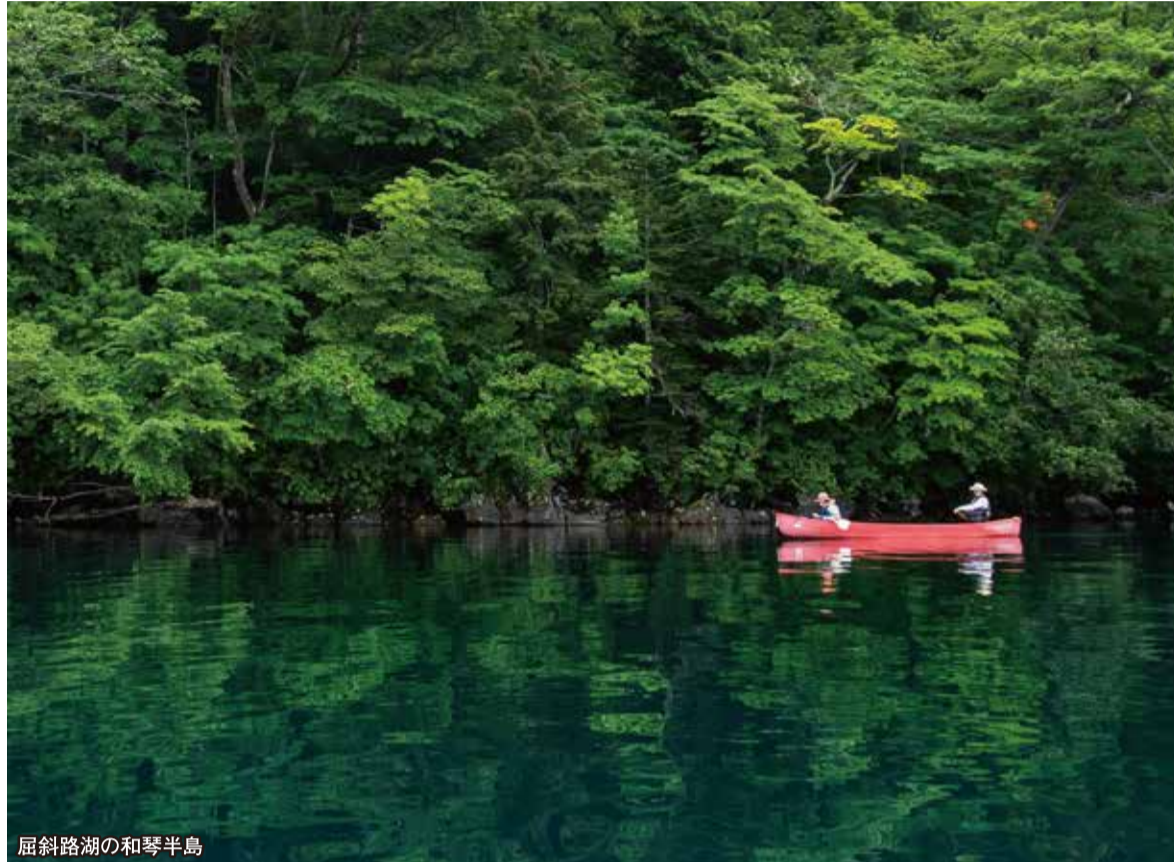
屈斜路湖の和琴半島

湖のカヌー マリモを育む「阿寒湖」や日本最大のカルデラ湖「屈斜路湖」で絶景カヌー体験