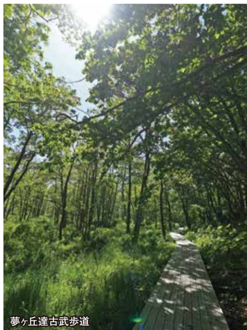
夢ヶ丘達古武歩道