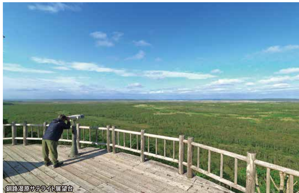
釧路湿原サテライト展望台