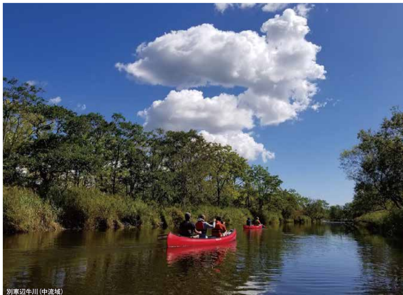
別寒辺牛川(中流域)