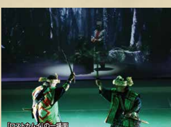
「ロストカムイ」の一場面

アイヌ古式舞踊や工芸家の作品に多く出会うのが阿寒湖アイヌコタンを中心とする阿寒湖温泉街です。阿寒湖アイヌシアター「イコロ」をはじめ、アートミュージアム「オンネチセ」などの施設があり、様々な体験イベントやガイドツアー等も実施されています。ほかにも、「釧路市立博物館」や白糠町の「ウレシバチセ」、弟子屈町の「アイヌ民族資料館」など、地域に根付いたアイヌ文化を学べる施設が多数あります。