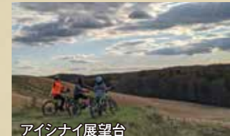
アイヌナイ展望台