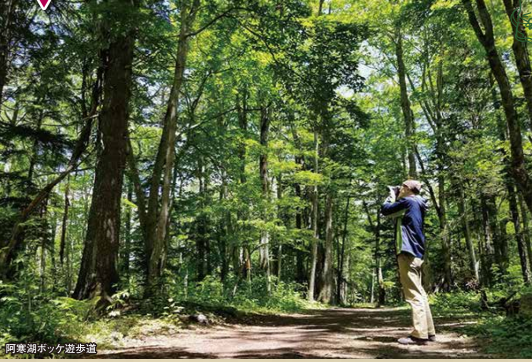
阿寒湖ホッケ遊歩道