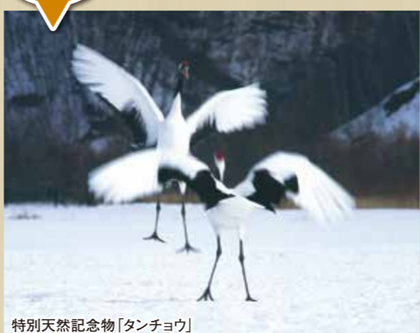
特別天然記念物「タンチョウ」

手つかずの森と湖沼、湿原がひろがるくしろ地域には、特別天然記念物のタンチョウをはじめオオワシ、オジロワシ、クマガラなど数多くの貴重な鳥たちが生息しています。オオハクチョウなどの渡り鳥も含め、四季を通じて様々な野鳥を観察できることから、国内外からバードウォッチングを目的に訪れる観光客が絶えません。特に冬の鶴居村では雪景色のなかを舞う美しいタンチョウが人気。近年は生息数が増え季節を問わず見られます。