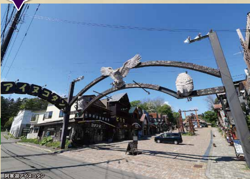
阿寒湖アイヌコタン

アイヌ古式舞踊や工芸家の作品に多く出会うのが阿寒湖アイヌコタンを中心とする阿寒湖温泉街です。阿寒湖アイヌシアター「イコロ」をはじめ、アートミュージアム「オンネチセ」などの施設があり、様々な体験イベントやガイドツアー等も実施されています。ほかにも、「釧路市立博物館」や白糠町の「ウレシバチセ」、弟子屈町の「アイヌ民族資料館」など、地域に根付いたアイヌ文化を学べる施設が多数あります。