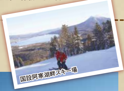
国設阿寒湖畔スキー場

くしろ地域でのカヌーは湖沼と川の両方が楽しめます。特別天然記念物のマリモが生息する阿寒湖では、そびえ立つ雄阿寒岳をバックに雄大な自然を体感できます。また、国内最大のカルデラである屈斜路湖は湖上だけでなく釧路川源流の川下りコースも楽しめます。さらに、塘路湖をスタートして釧路湿原の河川をゆったりと下るコースも人気です。水鳥観察には湿原でのカヌーが最適。主に別寒辺牛湿原や霧多布湿原で体験できます。