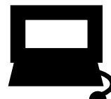
インターネットバンキング ダイレクト納付