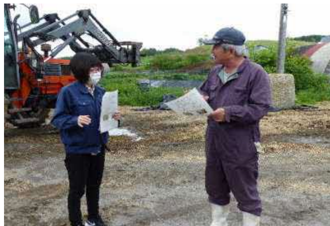
農業者への巡回調査の様子

また地域の子牛の販売状況を分析し、初乳給与量の改善など現状からさらに価値を高められる技術提案をしていきます。