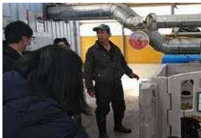
哺育舎のダクト換気方法を学びました