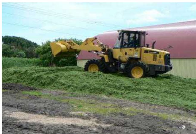
中オソツベツ地区のスタック形成作業

R3年度からは、標茶町中オソツベツを対象地域として、①サイレーシ調製・発酵品質の改善(牛にもう一口食べ込ませる草づくり)と、②哺育育成管理の改善の2つのテーマで地域の乳生産性向上と所得向上に向けて活動を進めています。