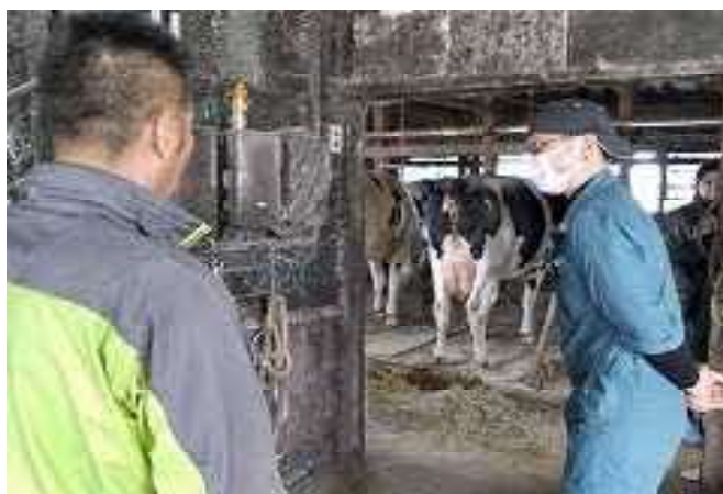
牛を見ながら飼料給与について学ぶ会員

今後は、個別に実施した視察内容を会員間で共有しそれぞれの経営に活かしていく予定です。