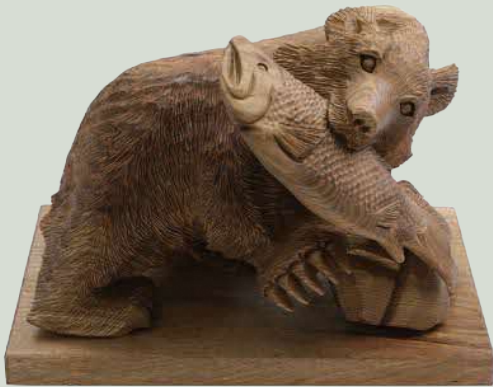
【キンムカムイ(えぞひ熊)】 令和3年度 優秀賞