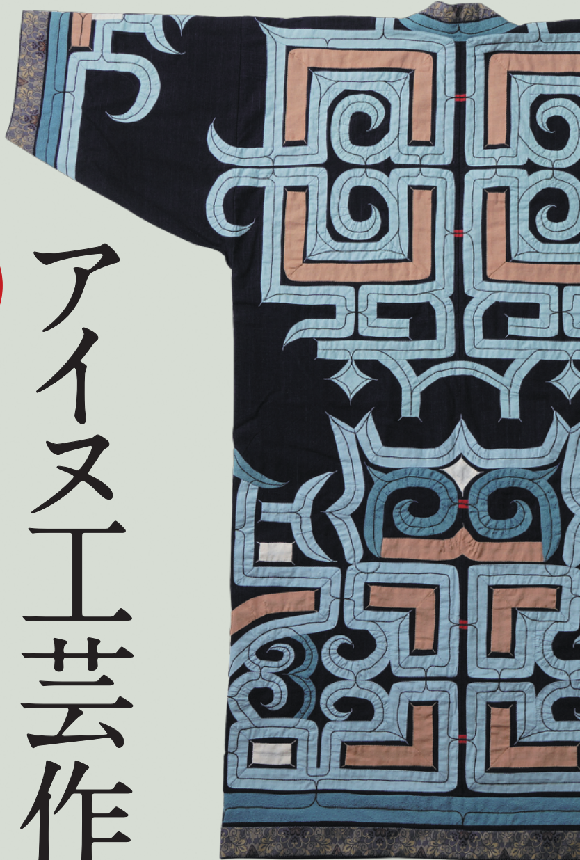
【ひかり】 令和3年度 優秀賞

アイヌの伝統技術を用いた工芸品や それらの技術を活用した 現代的創作作品を展示します。