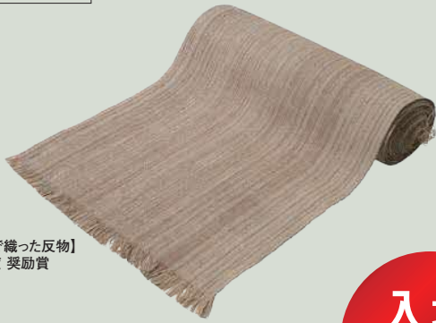
【オヒョウの皮で織った反物】 令和3年度 奨励賞