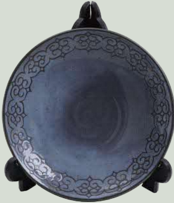
【海のうつわ】 令和3年度 奨励賞