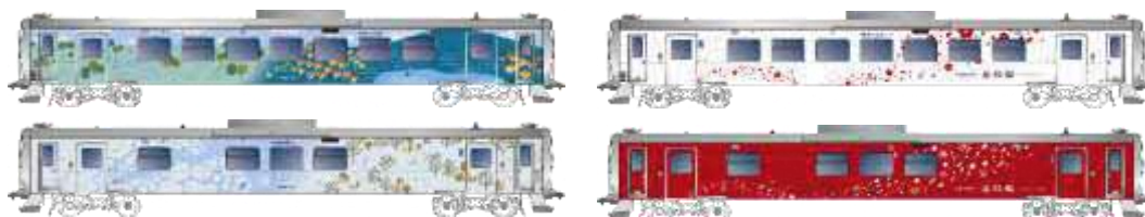
釧網線ラッピング