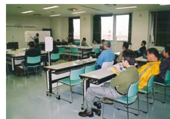
釧路川ふるさとの川推進懇談会