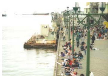
絵画コンクールの様子