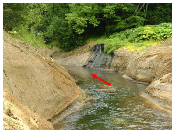
KP14.3 付近の河床低下区間の状況(2)