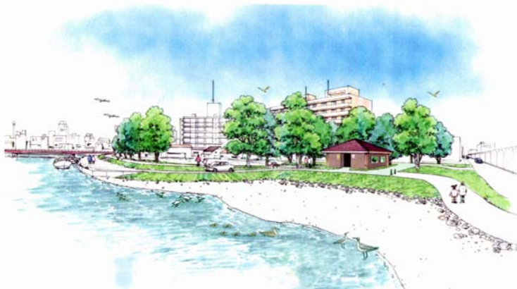
図 2-2 干潟復元のイメージ

釧路川の汽水域には干満の影響により干潟が出現し、底生動物やそれを求めて飛来する鳥類の宝庫となっている。そのため改修計画を進めるに当たっては、現状の干潟を極力保全するよう、またやむを得ず掘削する場合においても干潟が復元されるよう配慮する。