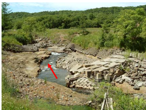
KP16.0 付近の河床低下区間の状況(1)

この結果、湿原へ流入する土砂量が増加し、以前に比べて大量の土砂が湿原で堆積するようになり、湿原植生の変化など自然生態系への影響が指摘されている。