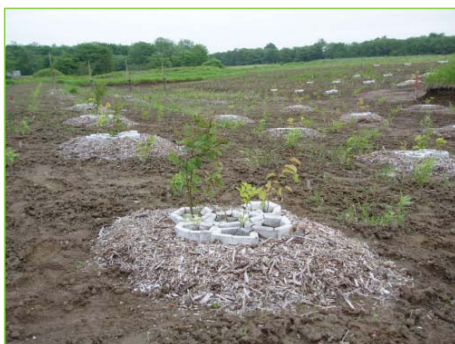
樹木の移植・植樹を実施