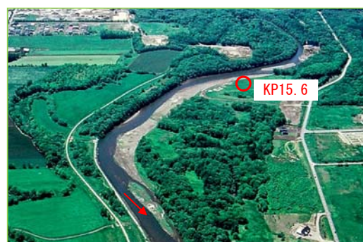
工事後の河道に多様な流れができつつある。