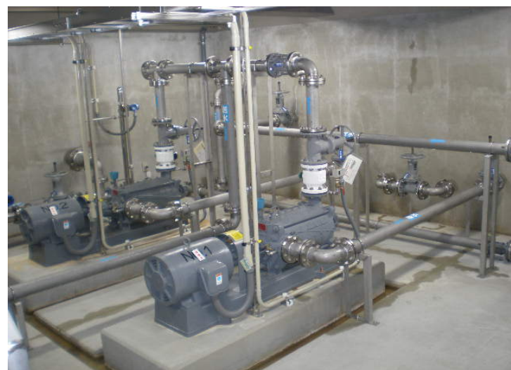
取水施設 送水ポンプ室