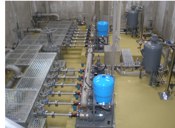
配水池施設(大別浄水場)送水ポンプ室