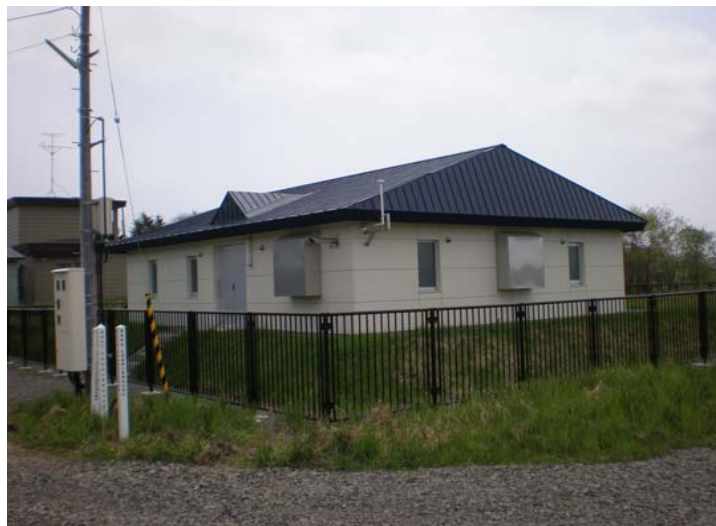
配水池施設(大別浄水場)