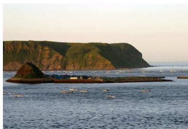
北太平洋シーサイドライン