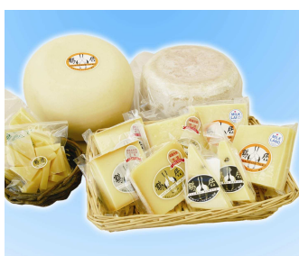
ナチュラルチーズ