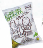
どんぐりのむら ポテトチップス POTETOCIPS