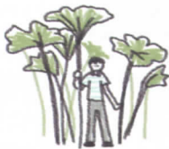
高さ2mを超える 足寄町名産のラワンぶき！