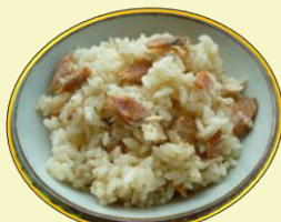
カッターチーズと鮭の炊き込みご飯