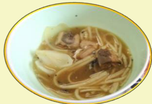
いわしの麦まるうどん