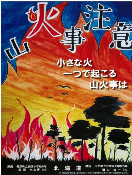
2024年山火事注意ポスター