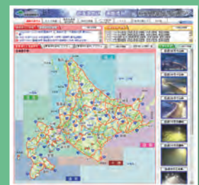
▲国道・道道の通行止め情報 (北海道開発局)

URL http://info-road.hdb.hkd.mlit.go.jp/