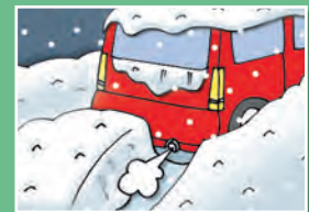
▲マフラー付近に注意!