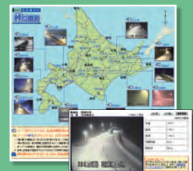
▲「北の道ナビ 峠情報」とライブカメラ画像

車から離れる際には、除雪や救助活動の妨げにならないよう、連絡先の書いた紙を車内におき、車の鍵を付けておきましょう。