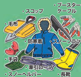
▲冬道運転の必需品

冬道を運転するための必需品(スコップ、スノーヘルパー、牽引ロープ、長靴、防寒服、手袋、毛布等)を車に準備しましょう。