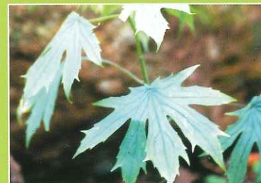
モミジガサ(シドケ)