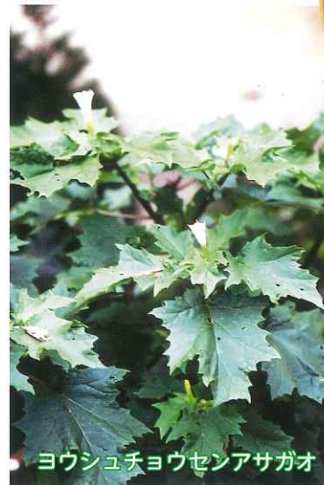
ヨウシュチョウセンアサガオ