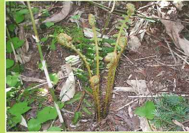
ヤマドリゼンマイ