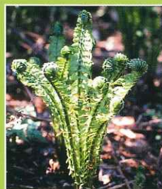
クサソテツ(コゴミ)