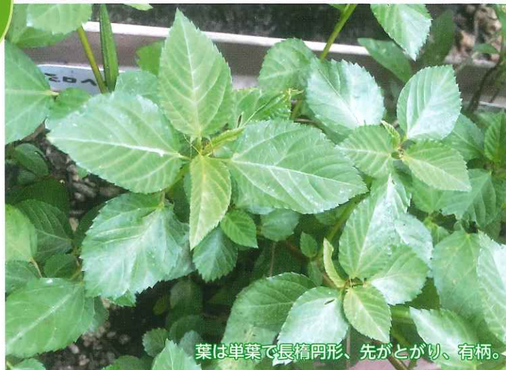
葉は単葉で長楕円形、先がとがり、有柄。