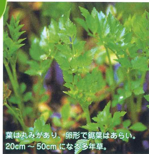
葉は丸みがあり、卵形で鋸葉はあらい。 20cm～50cmになる多年草。