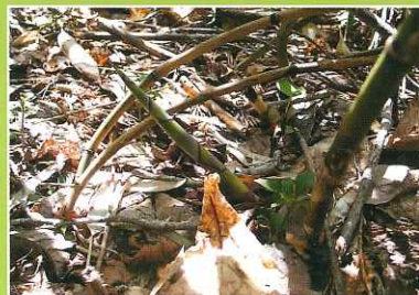
チシマザサ(タケノコ)