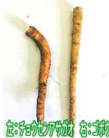
チョウセンアサガオの根