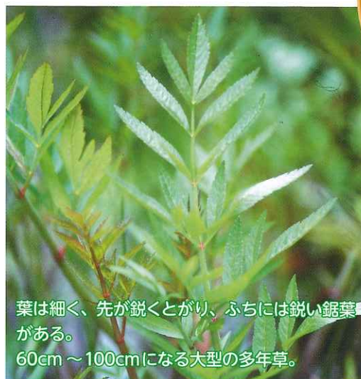
葉は細く、先が鋭くとがり、ふちには鋭い鋸葉 がある。 60cm～100cmになる大型の多年草。