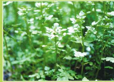
オランダガラシ(クレソン)