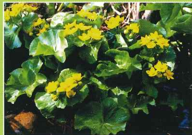
エゾノリュウキンカ(ヤチブキ)