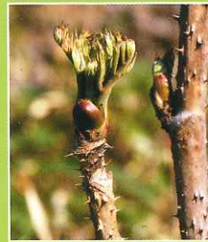
タラノキ(タランボ)