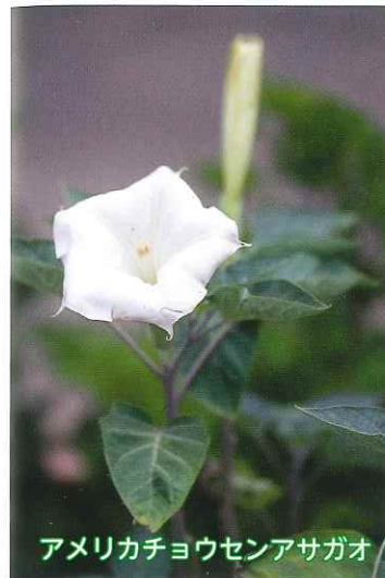
アメリカチョウセンアサガオ