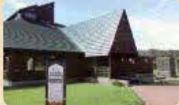
MAP 05 厚岸水鳥観察館

厚岸湖・別寒辺牛湿原に生息する貴重な動植物の生態や四季折々の自然を大迫力の大モニターで紹介。2階観察コーナーからの水鳥観察がオススメ。