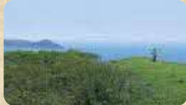
MAP 03 しほ 尻羽岬

太平洋、厚岸湾、大黒島を一望できるスポット。駐車場から岬の先端までは徒歩約20分。崖下には義経伝説が伝えられる帆掛岩があります。