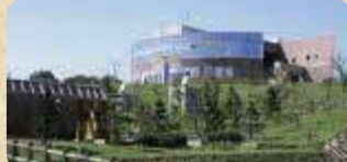
MAP 11 霧多布湿原センター

霧多布湿原の情報ステーション。見晴らし抜群の展望ホールにはコーヒショップがあり、地元の食材を使った食事も楽しめる。湿原のエコツアーやマウンテンバイクツアーもある。(要予約)