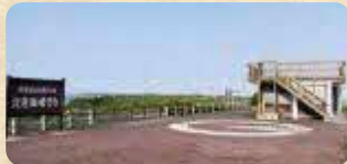
MAP 13 びわせ 琵琶瀬展望台

北側は広大な霧多布湿原を琵琶瀬川が蛇行する大パノラマ、南側は太平洋。ドライブの休憩スポットとしてもおすすめです。