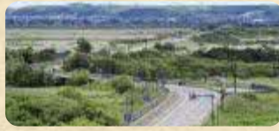
MAP 10 MGロード

霧多布湿原の中央部を縦断するように通っているのが「MGロード」。名前のMGとは「Marshy Grassland」、つまり「湿原」のこと。歩道が整備されているので、散策やサイクリングがおすすめ。