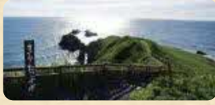
MAP 12 霧多布岬

その名のとおり、日本一「霧の多い」海域に突き出した岬で、正式には湯沸(トウフツ)岬という。周辺にはバンガローのある霧多布岬キャンプ場がある。