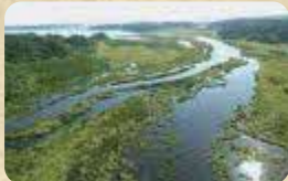
MAP 08 べかべか 別寒辺牛湿原

ヨシ、スゲの広がる低層湿原で、多くの野鳥が生息する。尾幌川、大別川、別寒辺牛川などが流れており、カヌーを楽しむこともできる。