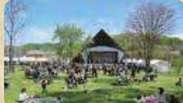
MAP 04 べっほ 別保公園・釧路町地産地消センターロバザール

毎年5月下旬に日本一遅い桜まつりが開催される桜の名所。地元釧路町の特産物や野菜、工芸品などを販売している。