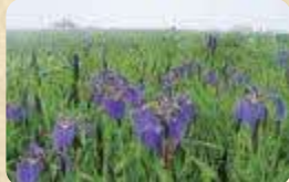
MAP 02 原生花園あやめヶ原

厚岸町市街地から約12kmあたりに位置し、「チンペの鼻」と呼ばれる断崖をもつ台地の岬が広がる。ヒオウギアヤメの群生地であり、毎年6月下旬から7月上旬まで「あやめまつり」が開催される。