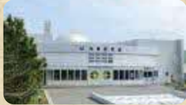
MAP 07 厚岸町海事記念館

愛冠岬手前にあり、希少な海産生物、陸上哺乳類、鳥類、化石などの標本約2000点を展示している。 ●開館/9:00~16:30(5月1日~10月31日) ●定休日/月曜日・火曜日(祝日を除く)及び11月1日~翌4月30日 ●TEL/0153-52-2056(厚岸郡厚岸町愛冠)