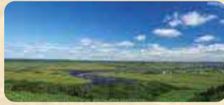
MAP 09 霧多布湿原

初夏にはワタスゲ、エゾカンゾウ、ヒオウギアヤメなどで埋め尽くされ、花の湿原とも呼ばれるほど。木道を歩くと、それらの花を間近に見ることができる。