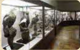
MAP 06 アイカップ自然史博物館

愛冠岬手前にあり、希少な海産生物、陸上哺乳類、鳥類、化石などの標本約2000点を展示している。 ●開館/9:00~16:30(5月1日~10月31日) ●定休日/月曜日・火曜日(祝日を除く)及び11月1日~翌4月30日 ●TEL/0153-52-2056(厚岸郡厚岸町愛冠)