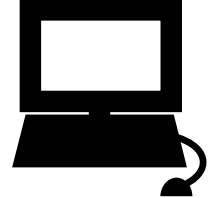
インターネットバンキング ダイレクト納付