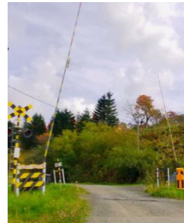
「ホテルローヤル」の撮影が行われた釧路町の路地