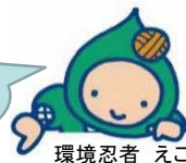
環境忍者 えこ之助