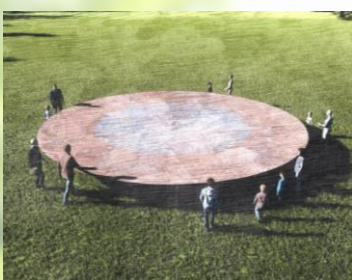
4 Plate (of 100 meters arc)