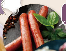
放牧牛 チョコソー