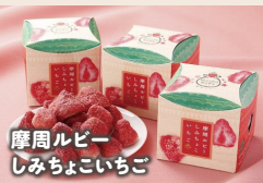
摩周ルビー しみちよいちご