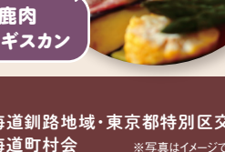
鹿肉 ジンギスカン