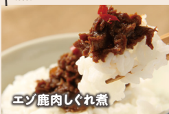
エゾ鹿肉しぐれ煮

食の宝庫・北海道くしろ地域の水産加工品や 乳製品など、特産品をたっぷりお届けします!