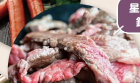
星空の黒牛 鉄板焼き