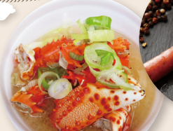
花咲がにの 鉄砲汁