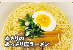
あさりの あっさり塩ラーメン