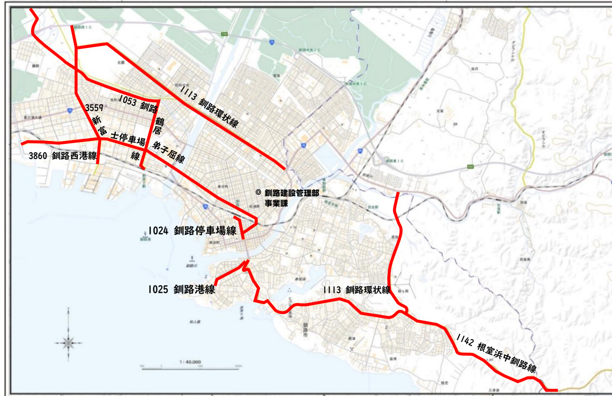
釧路市街地拡大図