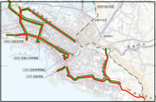
釧路市街地拡大図