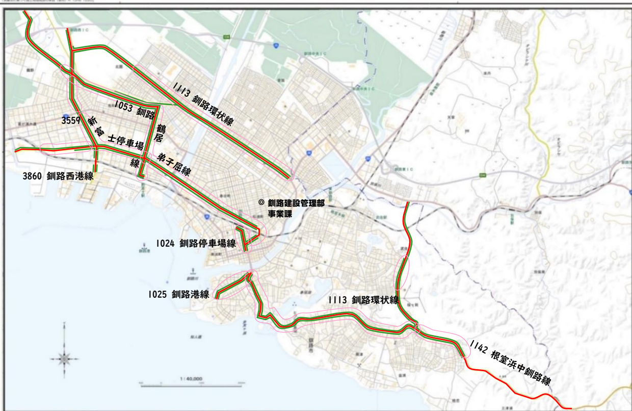
釧路市街地拡大図