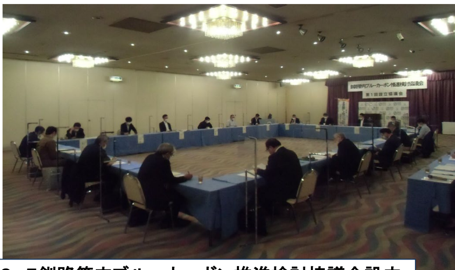
R4. 9. 5釧路管内ブルーカーボン推進検討協議会設立