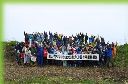
シマフクロウの森づくり 百年事業植樹祭