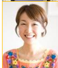
食品ロス削減セミナー 参加者：町民50名 R.5.7.29（土） 開催