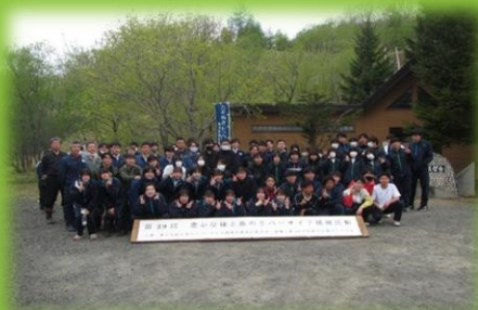
豊かな森と魚の リバーサイド植樹